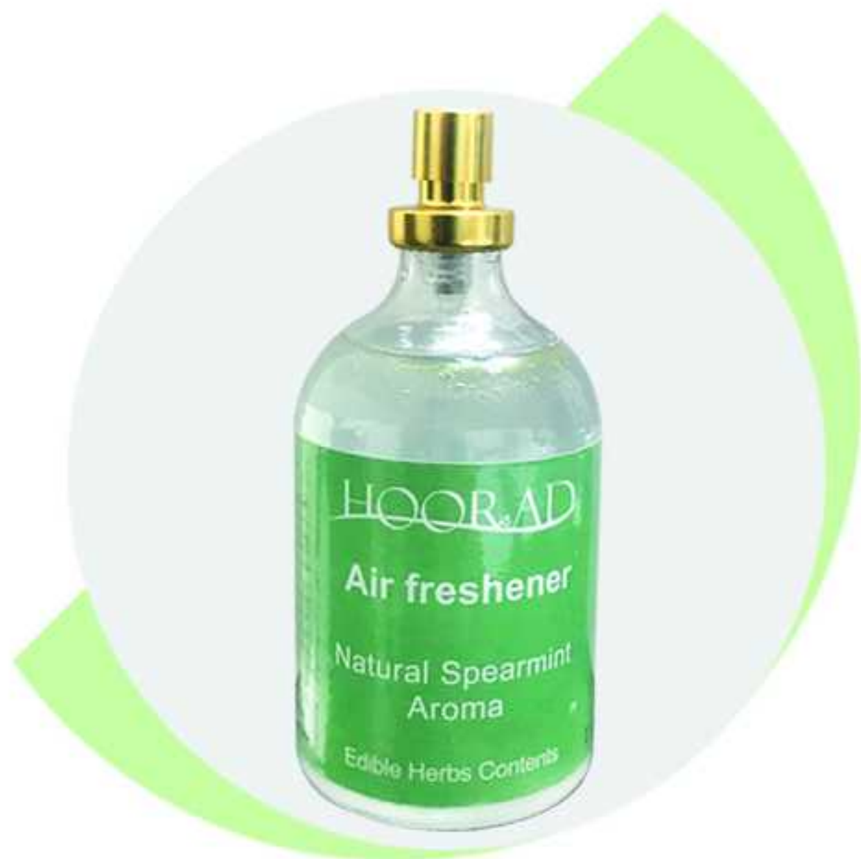
Natural Aroma Air Freshener