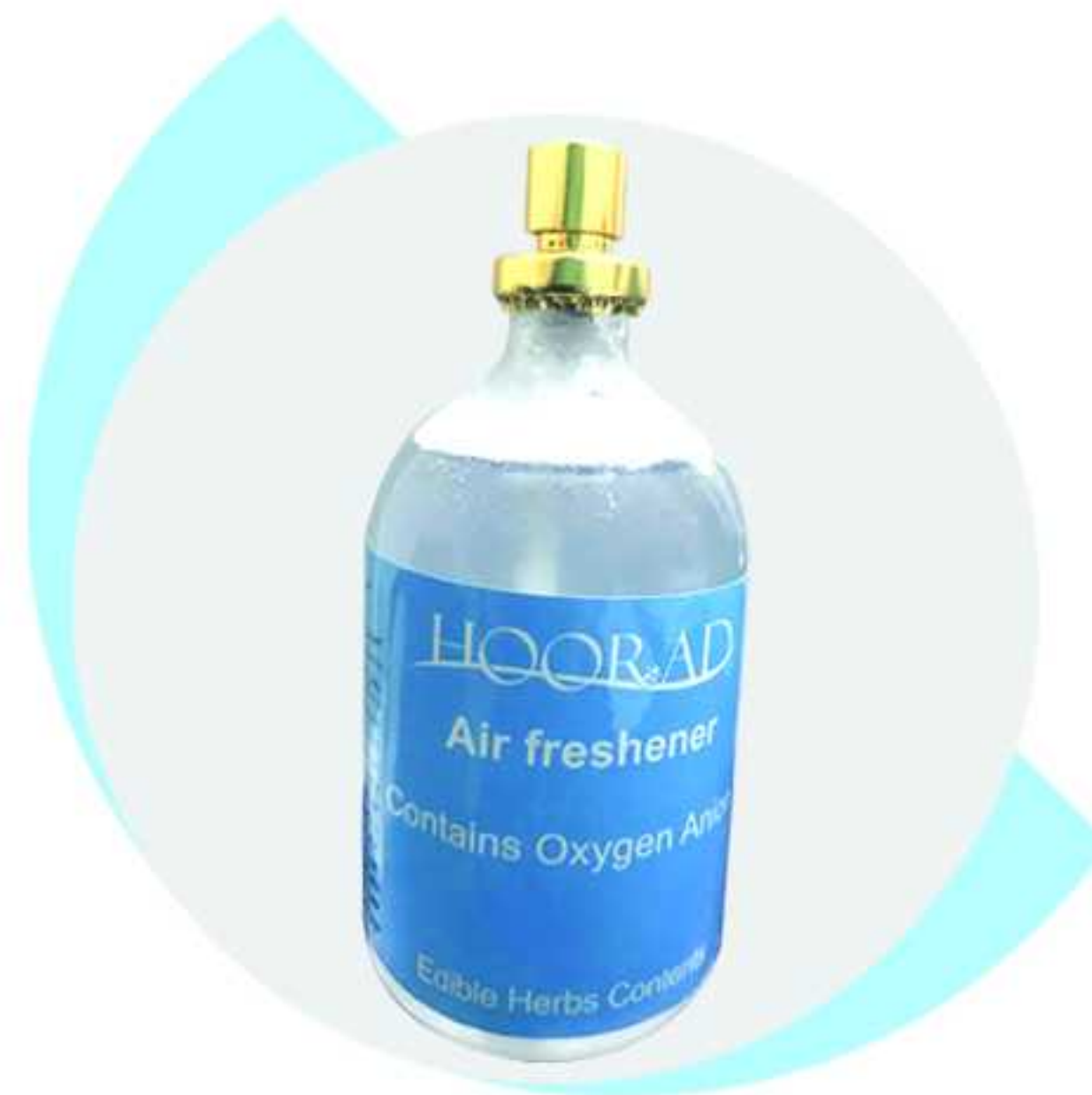
Oxygen Anion Air Purifier